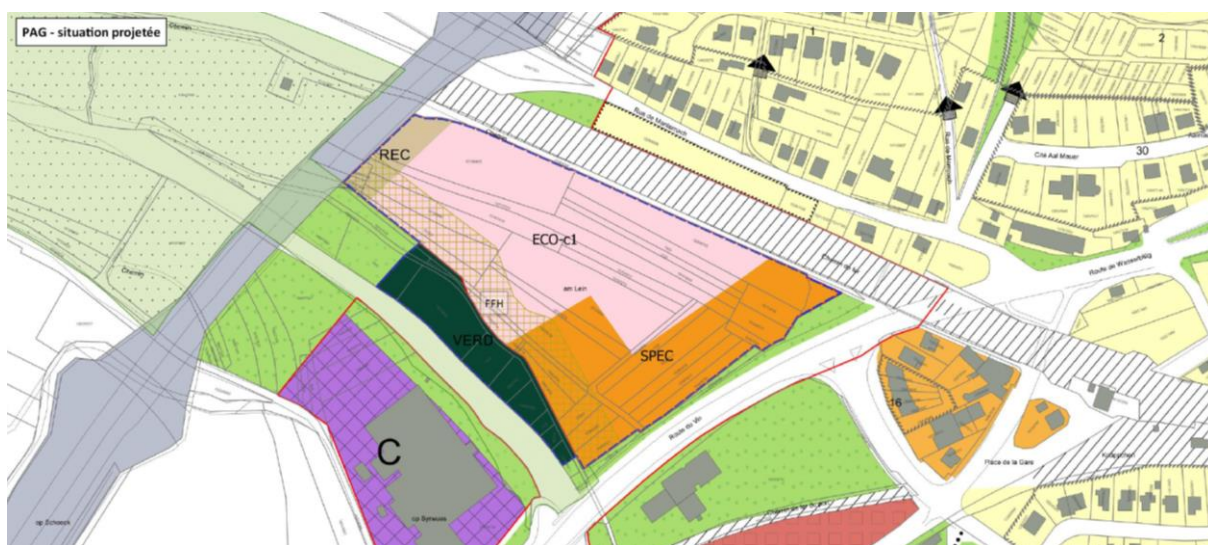
Abb. 4: PAG – Situation projetée (Zilimplan 2018)