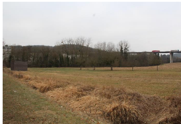
Blick in Richtung Norden (Luxplan S.A.; 26.01.2017)