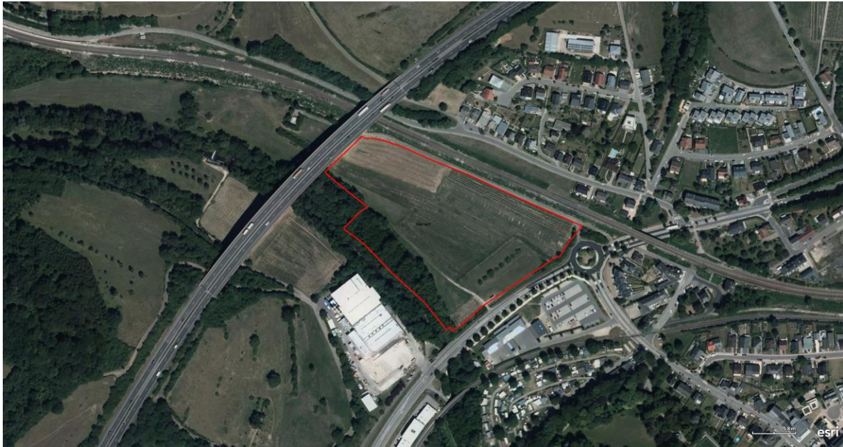
Abb. 5: Orthofoto der Planzone und deren Umgebung (ACT 2017)