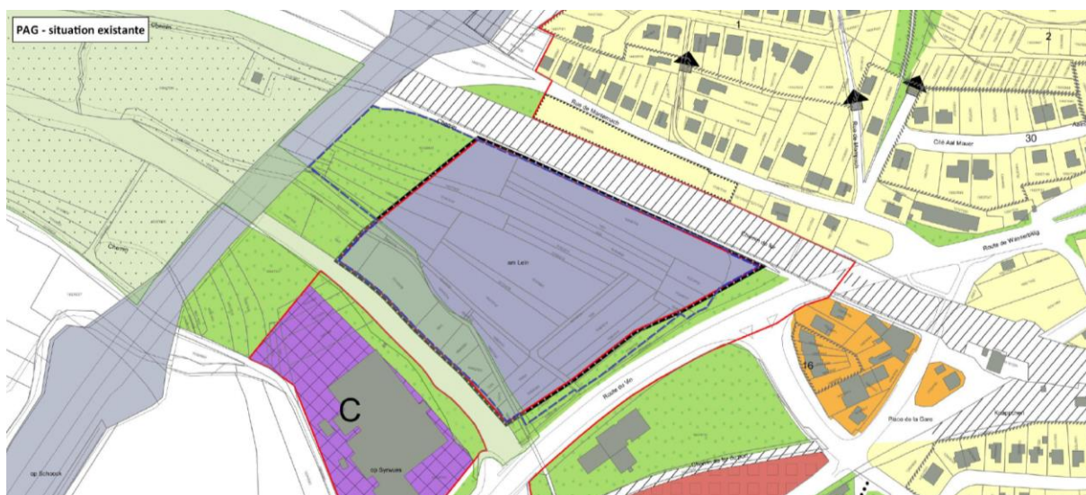
Abb. 3: PAG – Situation existante (Zilimplan 2018)

Zudem soll die Zone nicht mehr vollumfänglich als ECO-c1, sondern teilflächig als SPEC, ECO-c1, REC und VERD ausgewiesen werden. Somit ist es möglich die große Fläche besser an die angestrebten Nutzungsformen anzupassen bzw. die spätere Nutzung genauer zu lenken.