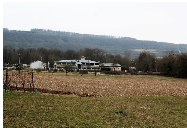
Blick in Richtung Südosten