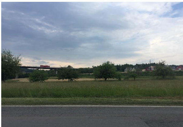
Blick in Richtung Nordwesten