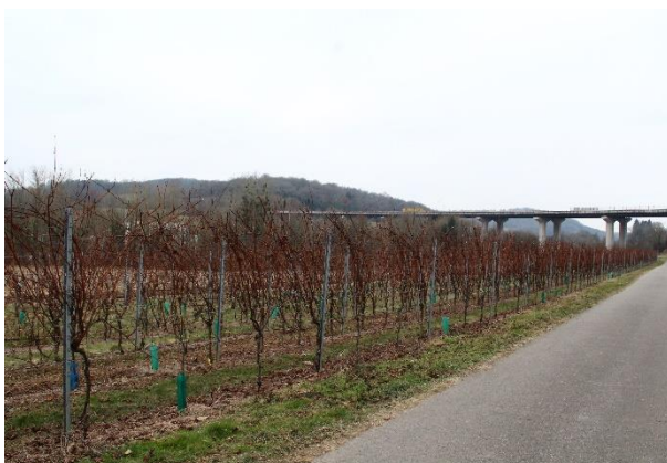
Blick in Richtung Norden