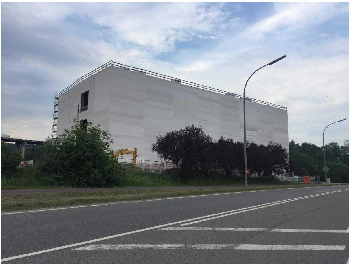
Abb. 6: Neues Firmengebäude Technofibres S.A. auf westlicher Syre-Seite (Luxplan S.A. 05/2018)

Zum anderen muss darauf hingewiesen werden, dass im Bereich des gegenüberliegenden Ufers der Syre ein überaus großes neues Fabrikgebäude entsteht (Technofibres S.A.), welches bis an den bestehenden Gehölzstreifen heranragt. Aufgrund der Planungen im Bereich der Zone „Am Leim“ muss im Gegensatz hierzu nicht mit einem solchen Effekt gerechnet werden, da eine Art Handwerkerhof geplant ist. Die zugehörigen Gebäude und Hallen werden nach aktuellem Stand nicht die enormen Ausmaße erreichen wie jene auf der gegenüberliegenden Syre-Seite.